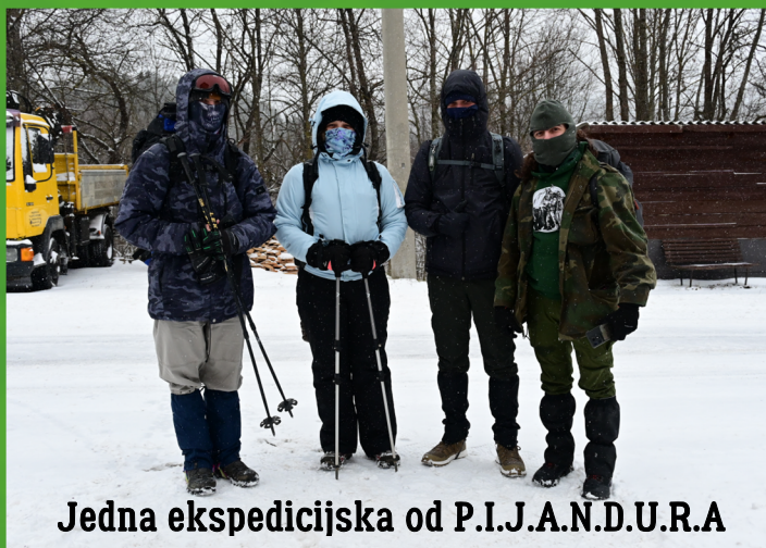
Jedna ekspedicijska od P.I.J.A.N.D.U.R.A

Prije svega, dramatičnost ovog izvještaja odraz je iskustva i osjećaja autorice koja živi pretežno sjedilačkim načinom života. Unatoč tome, želim naglasiti da mi je izlet bio lijep i uzbudljiv, iako naporan.