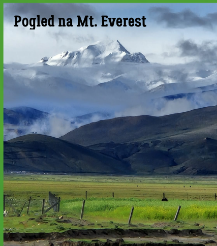
Pogled na Mt. Everest

Ujutro nas je čekalo još 18 kilometara po serpentinama do našeg cilja. Moje stanje se redovno pogoršavalo. Dodatan osjećaj u tijelu, uz sve do sada, bio je pritisak u plućima, ali nastavio sam dalje na autopilotu te je tih 18 km prošlo jako brzo. Jako sunce zapeklo je zemlju, stijene i moju kožu punu irskih gena koja je nastradala. Osjetila su mi otupila, vidio sam samo cestu pod svojim nogama i čuo samo svoj dah. Dolazak u EBC na 5400 m proslavljen je vrućim čajem i širenjem propagande P.I.J.A.N.D.U.R.A.. Mt Everest je bio predivan. Opet sam zurio u njega i dobio sam veliki poriv popeti se, ali nekoliko stepenica me vrlo brzo vratilo u stvarnost. Posjetili smo najviši samostan na