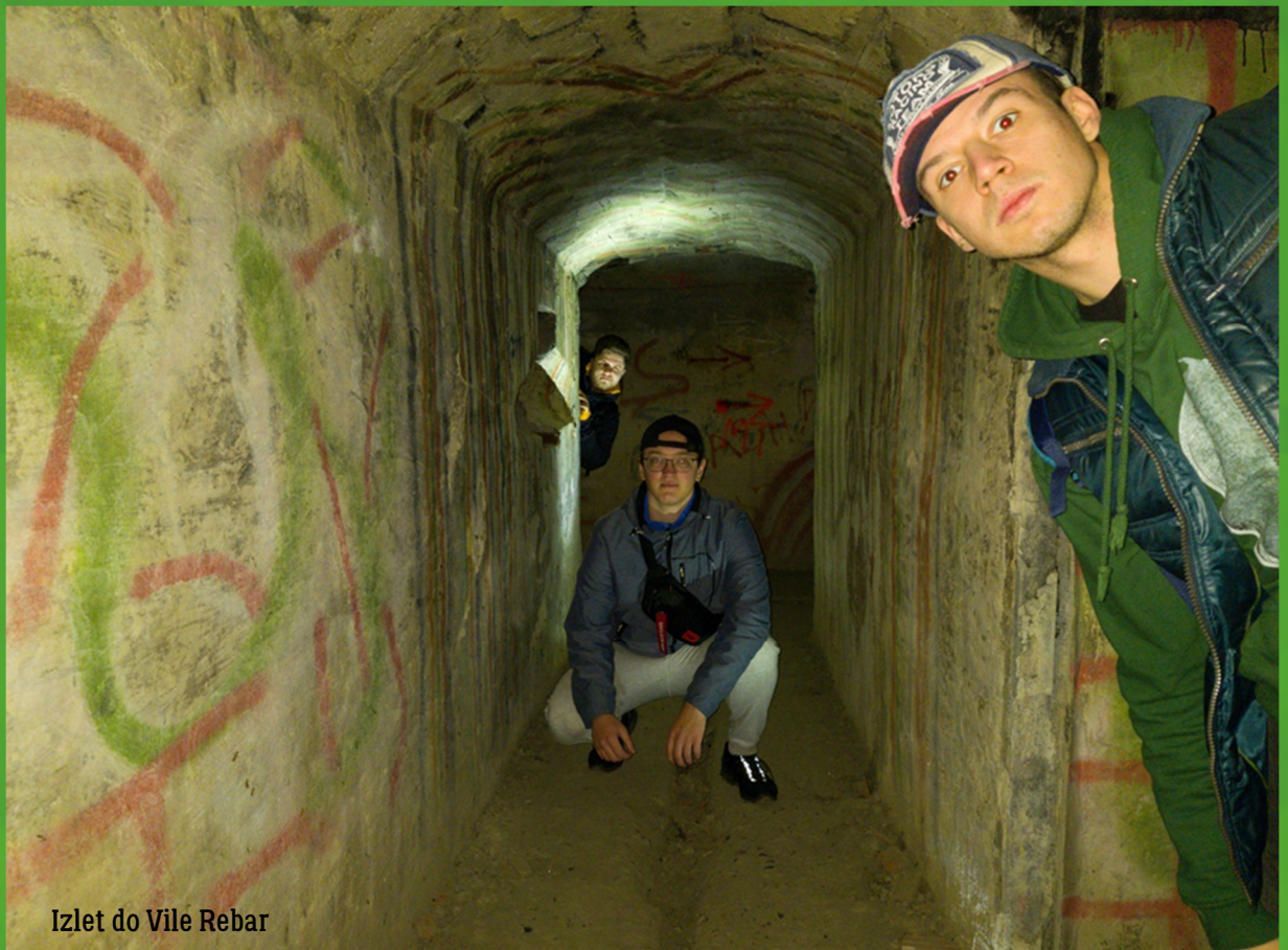
Izlet do Vile Rebar