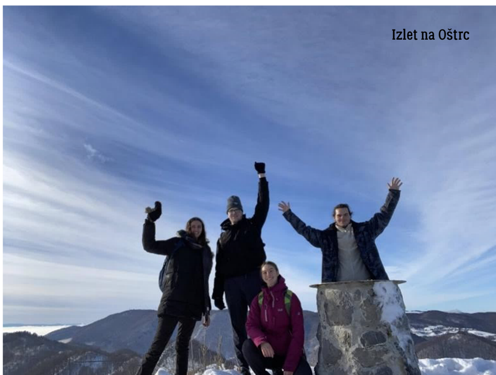
Izlet na Oštrc