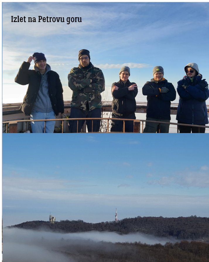
Izlet na Petrovu goru

Savjet: Posadite začinsko bilje na balkonu. I.Š.