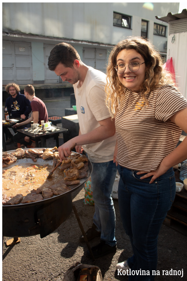
Kotlovina na radnoj