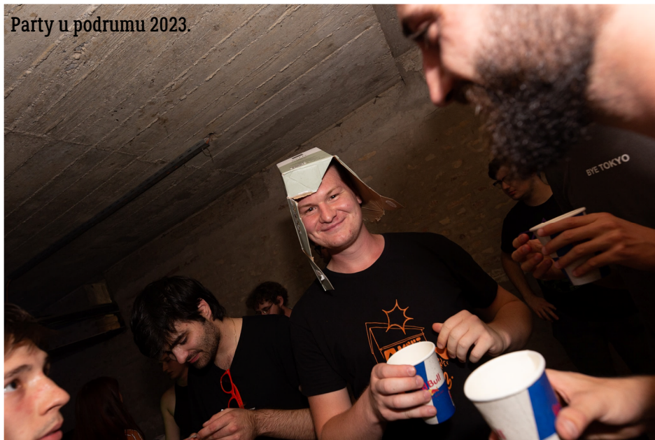
Party u podrumu 2023.

„Lijep je bio jedan period di su svi bili kao: „Da, mogli bi ić pit u podrum FER-a jer zašto ne?“, sad kad malo razmislim, ne mogu vjerovat da je nekoliko mjeseci redovito 20ak ljudi bilo u tom podrumu svojevajjno i sretno!“