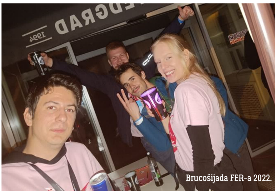
Brucošijada FER-a 2022.