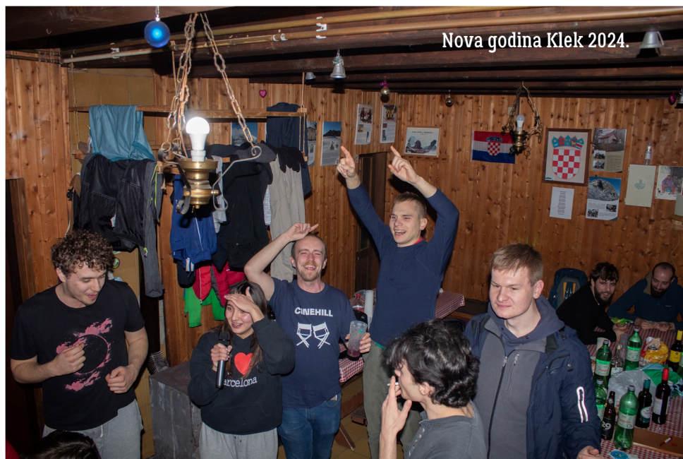
Nova godina Klek 2024.

„Uh, legendarni koncept čišćenja dok neko pjeva karaoke i ciklički se vrte ljudi u krug za mikrofonom“