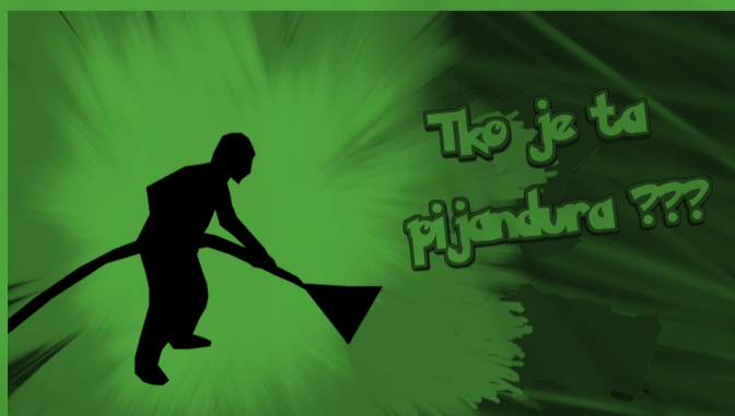
slika: Tko je ta pijandura???

Prošli mjesec, točnije 6. travnja, održana je skupština KSET-a. To je najveći KSET party u godini na kojemu se održava tradicionalna svečanost (takozvani „službeni dio“) nakon kojeg slijedi fešta. Hrana i piće budu za dž kao nagrada svima koji su marljivo doprinijeli obnovi kluba za vrijeme skupštinskih radova. Pozvani su svi trenutni članovi KSET-a, crveni članovi te gosti koji mogu doći kao +1 onima koji su se iskazali na radovima. Tijekom „službenog“ dijela prikazano je kroz prezentacije što su sekcije i timovi radili tijekom godine te su izneseni planovi za budućnost. Novi šefovi sekcija preuzeli su svoje odgovornosti, a članovi kluba koji su se istaknuli požrtvovnim radom za KSET (tijekom ove godine) dobili su zahvalnice ili su (za sveukupni doprinos tijekom svih godina članstva) dobili počasne crvene iskaznice. Vrhunac „službenog“ dijela bio je dugoočekivani western Kaktus u podne koji nije razočarao vjerne obožavatelje, a nakon toga je počela zabava na kojoj se plesalo do jutra. Gdje su u tome svemu bili vaši najdraži Pi? Pekli meso vani i brinuli se da svi budu siti kako se ne bi prebrzo napili... ;) I.D.